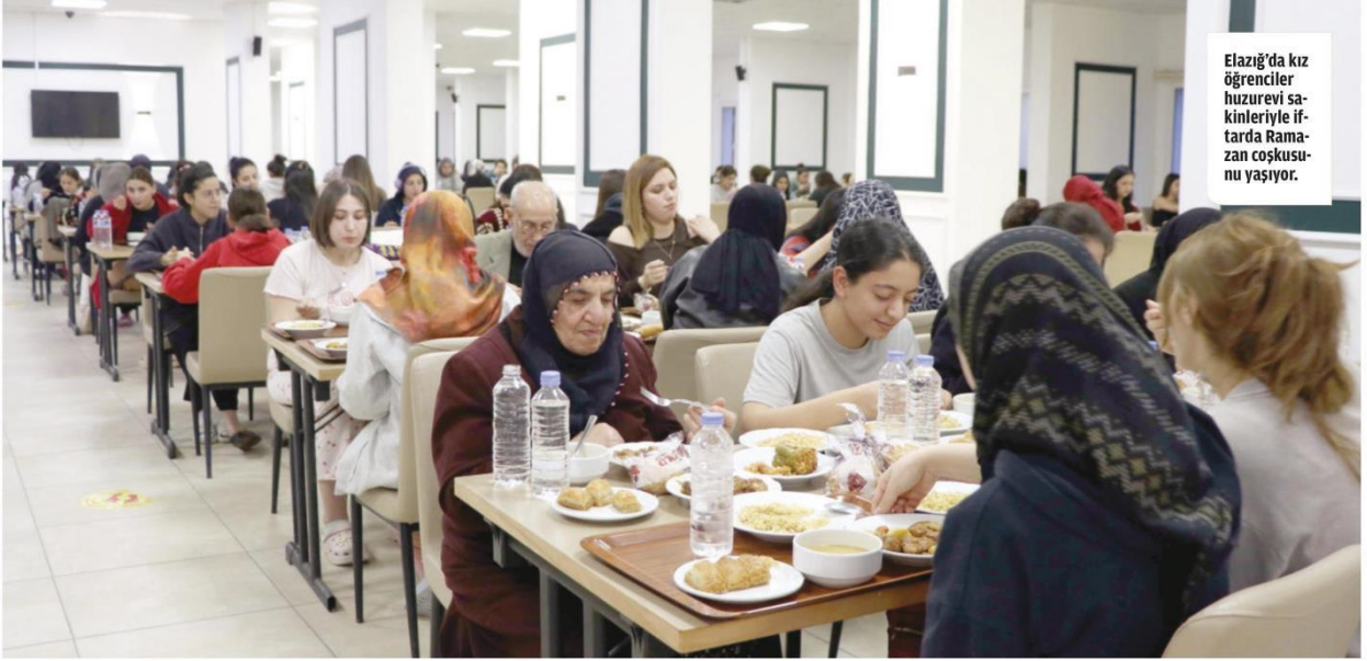
Elazığ'da kız öğrenciler huzurevi sakinleriyle iftarda Ramazan coşkusu- nu yaşıyor.